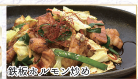
鉄板ホルモン炒め