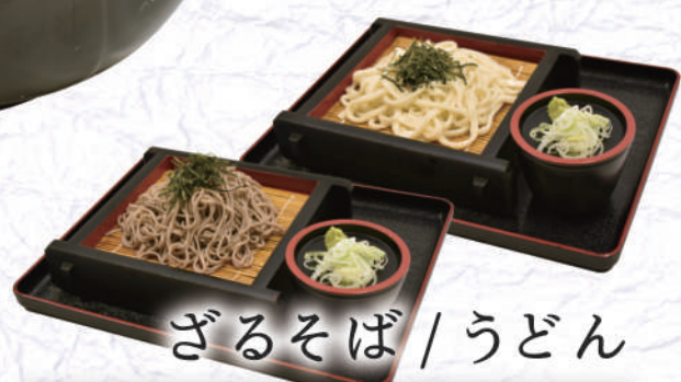
ざるそば / うどん