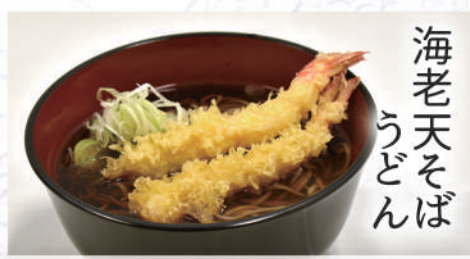
海老天そば うどん