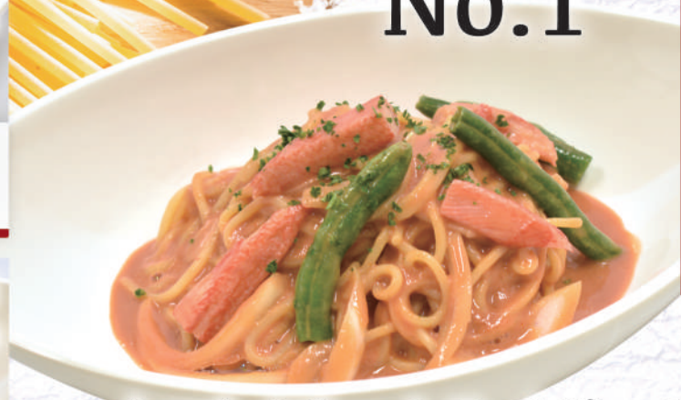
トマトクリームスパゲッティ

スタッフ人気 No.1！さわやかなトマトの酸味と クリームのコクが相性バツグン！