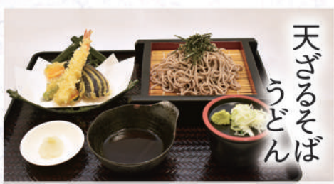
天ざるそば うどん