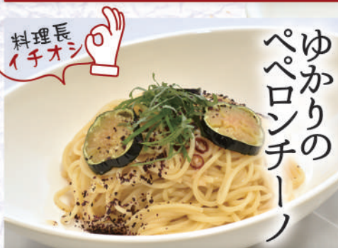
ゆかりの ペペロンチーノ