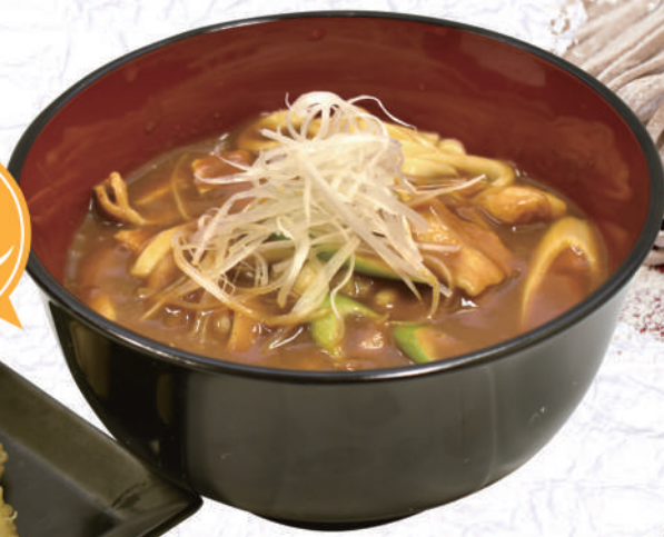
バナナ天ぷらと カレーうどん

当店イチ攻めたイチオシメニュー！ 和風だしの利いた自家製カレーうどんと バナナ天ぷらのセットです♪