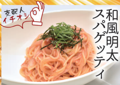
和風明太子 スパゲッティ